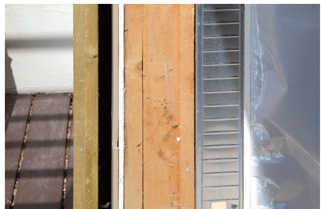
Efterisolering af let ydervæg udført før BR15. Konstruktion set fra ydersiden (venstre): Regnskærm af brædder, hulrum, vindgips, eksisterende træskelet incl. 100-125 mm isolering, ny indvendig isolering i stålskelet, dampspærre og gipsplader.

Dampspærren kan placeres op til en tredjedel inde i den samlede isoleringstykkelse fra den varme side. Det muliggør indbygning af stikdåser mm uden, at dampspærren gennembyrdes.