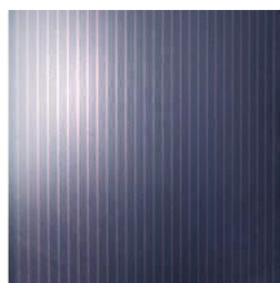
Tyndfilm (amorph silicium, CIS, CdTe)

Moduler med krystallinsk silicium er de ældste, mest udbredte og mest effektive solceller. De kendes på den typiske inddeling i et antal firkantede celler på størrelse med en stor håndflade.