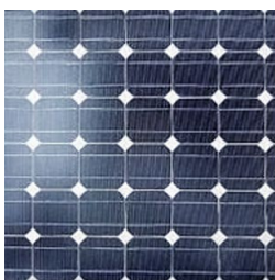
Krystallinsk silicium (mono, poly)

Man skelner normalt mellem de to mest almindelige kategorier af solcelleteknologier, som er: